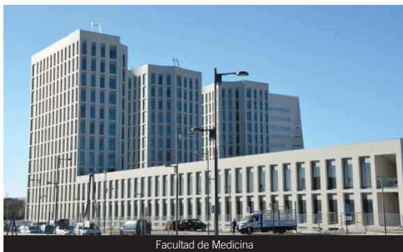
Facultad de Medicina